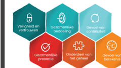
kernvoorwaarden betekenisvolle zorgrelaties